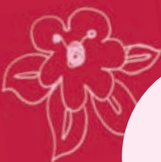
Poudre à laver linge Ecover - 1,2 kg 18 lavages