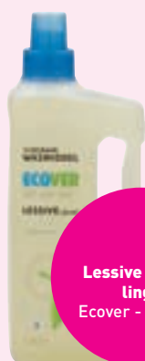
Lessive liquide linge Ecover - 1,5 litre

S'il est malheureusement inévitable que les résidus de lavage se retrouvent dans la nature, ces derniers devraient se dégrader entièrement et rapidement . Or, la réglementation à cet égard est peu contraignante car elle impose seulement que les agents lavants (dits "tensio actifs") perdent leur efficacité au bout de 28 jours ! La loi ne prévoit rien quant à la biodégradabilité des autres composants qui entrent dans la composition des lessives classiques parfois à 80 %. Ainsi, une fois rejetés dans la nature, seuls 5 à 20 % des composants d'une lessive classique sont dégradés en 28 jours. Dans le même délai, une lessive écologique voit se dégrader la totalité