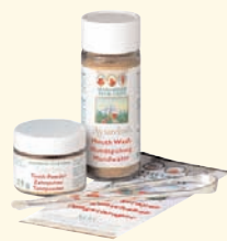
Poudre dentifrice ayurvédique Maharishi Ayurdent 25 g.

UN DENTIFRICE CONVENTIONNEL COMPREND EN MOYENNE UNE QUINZAINE D'INGRÉDIENTS AU RANG DESQUELS ON RETROUVE GÉNÉRALEMENT DES SOLVANTS, DES CONSERVATEURS (PARABENS), DES COLORANTS ET DES TENSIO-ACTIFS AGRESSIFS. ÉGALEMENT PRÉSENTES DANS LES SHAMPOINGS ET GELS DOUCHE, CES SUBSTANCES POLLUANTES SERVANT À MARIER L'HUILE ET L'EAU RENDENT LES PRODUITS "MOUSSANTS".